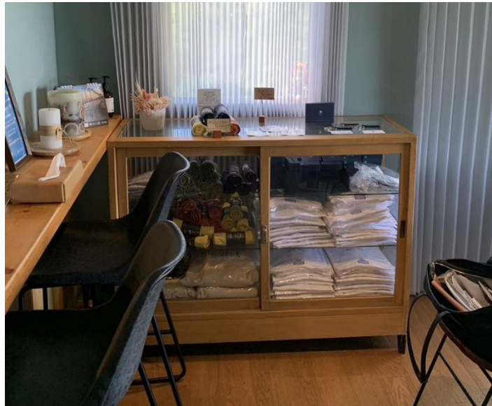
写真 4 THE GEEK の商品棚(2023 年 8 月 18 日筆者撮影)