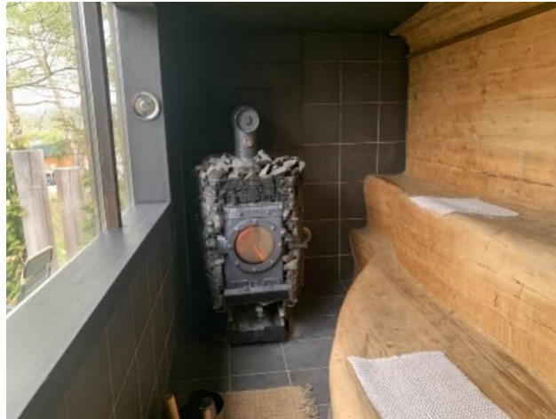
写真3 THE GEEK の薪ストーブ(2023年8月18日)